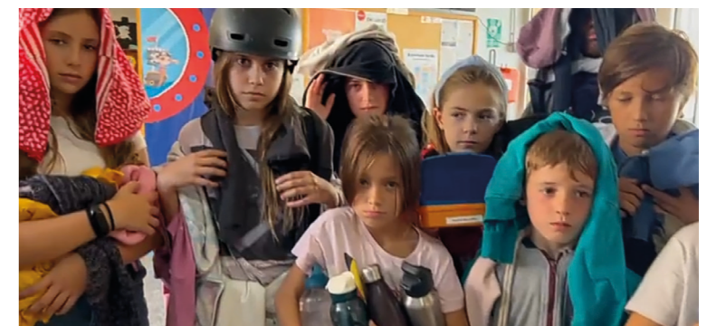
Imatge del vídeo fet pels Baules d'Infants per enviar a les famílies.

Tot això ens porta a donar valor a allò que tenim i, en conseqüència, ens remet a donar importància als espais i objectes que són dels altres i als espais i objectes que són d'ús comú. Són petites accions que poden ser imperceptibles a simple vista, però que ho diuen tot. I que ens ajuden a aprendre a valorar el que tenim.